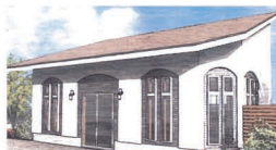
※上記パース図はイメージですので、実際とは異なる場合がございます。

正面入口から墓域内へ続く通路・園内の参道は、転倒やつまずきの危険を排除した段差のない設計。ご高齢の方や車椅子の方でも安心してご利用いただけます。また、参道工事はみかげ石で施工され高級感が溢れて、雨の日でも滑りにくい構造となっております。「サンク川口霊園」は、年齢や障害の有無に関わらず多くの人が利用できるようにデザインされた霊園となっております。