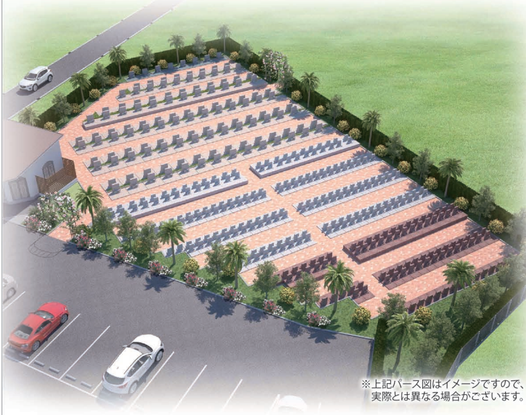
※上記パース図はイメージですので、実際とは異なる場合がございます。